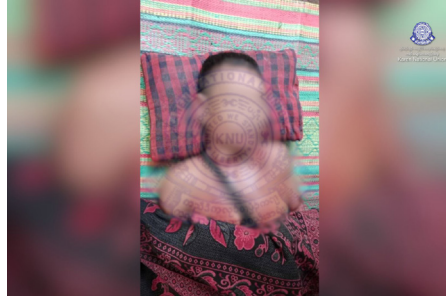
၂၀၂၄ နံၣ် လါအိၤကထိတဘျီ ၃၀ သီအန့ၤ သုးမိစီရိအသုးတဖၣ် ခးလီၤကၠိၤဖးဒိၣ်လၢ သဝီပူၤအဆၢ ဘၣ်သံဝဲ ကမၤဖိ ၀ ဂၤ ဖဲ ဒုပျၢၣ်ယၢ် ကီၢ်ရၢၣ်ဟီၣ်ကဝီၤပူၤ