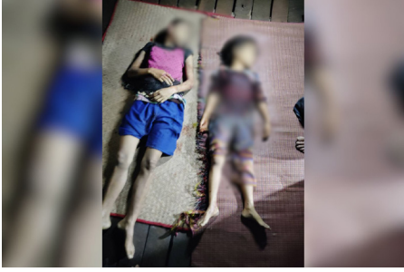
၂၀၂၄ နံၣ် လါနီၣ်တဘျီ ၂၅ သီတခါ ၆ န့ၣ်ရံၣ်အဆၢကတီၢ် သုးမိစီရိအသုးတဖၣ် ခးလီၤကၠိၤဖးဒိၣ်လၢသဝီပူၤအဆၢ ဘၣ်သံဝဲ ဖိသၣ်ပိၣ်မုၢ် ၂ ဂၤ ဖဲ ချၢၣ်လွၢ်ထွၢ်ကီၢ်ရၢၣ် ဟီၣ်ကဝီၤပူၤ