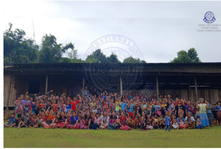
ချၢၣ်လွၢ်ထွၢ်ကီၢ်ရၢၣ် ကညီပိၣ်မုၢ်ကရၢ တီခိၣ်ရိၣ်ဖဲဒီး မၤဝဲတၢ်မၤဝဲတၢ်ဟတုၢ်တၢ်စုဆူခိၣ်တကးထီၣ်ပိၣ်မုၢ် ၁၆ သီ တၢ်ရဲၣ်တၢ်က့ၤ ဖဲ ချၢၣ်လွၢ်ထွၢ်ကီၢ်ရၢၣ် (၂၀၂၄ နံၣ် လါနီၣ်တဘျီ ၂၅ သီ)