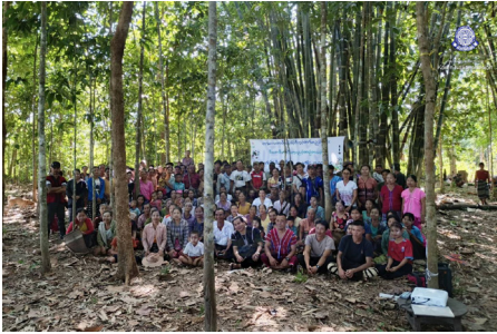
တၢ်မၤလၢကဝီၤ ဟီၣ်ခိၣ်ဒီးဖျၢၣ် တၢ်မၤညၢၣ်မုၢ်န့ၢ် ဖဲ ဒုသထွၢ်ကီၢ်ရၢၣ် တၢ်ဟဟီၣ်ကဝီၤပူၤ (၂၀၂၄ နံၣ် လါနီၣ်တဘျီ ၂၀)