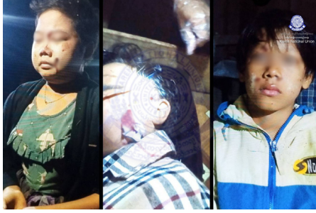
၂၀၂၄ နံၣ် လါအိၤကထိတဘျီ ၃၀ သီအန့ၤ သုးမိစီရိအသုးတဖၣ် ခးလီၤတၢ်လၢ ကမၤတၢ်ဖးဒိၣ်မအိၣ်အလီၤအက့ၢ်အဆၢ ဘၣ်ဒိဝဲ ကမၤ ၃ ဂၤ ဖဲ ဒုသထွၢ်ကီၢ်ရၢၣ်, ကွဲးထီၣ်ကီၢ်ဆၣ်ဟီၣ်ကဝီၤပူၤ