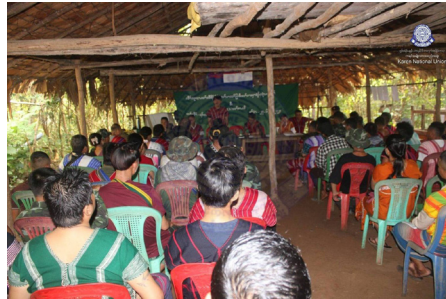
ဒုသထွၢ်ကီၢ်ရၢၣ် ရဲၣ်က့ၤမၤဝဲ တၢ်တီခိၣ်ရိၣ်ဖဲ, တၢ်ဟတၢ်ပြီးဒီး တၢ်ဟဆၢ ရဲၣ်က့ၤမၤဝဲ (CLV) တၢ်မၤလီၤဖဲ ဖၣ်အၣ်ကီၢ်ဆၣ်ဟီၣ်ကဝီၤပူၤ (၂၀၂၄ နံၣ် လါနီၣ်တဘျီ ၂၇ သီတုၤ လါနီၣ်တဘျီ ၆ သီ)