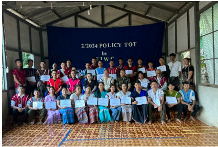
တၢ်ဟ့ၣ်တၢ်သ့ၣ်ညါဒီး ရဲၣ်ဖိၣ်သ့ၣ်ထီၣ်ဆီလီၤတၢ်မၤကမံးတံၢ် တီခိၣ်ရိၣ်ဖဲဒီး ရဲၣ်က့ၤမၤဝဲ Policy TOT တၢ်မၤလီ (၂၀၂၄ နံၣ် လါနီၣ်တဘျီ ၂ သီတုၤ ၂၈ သီ)