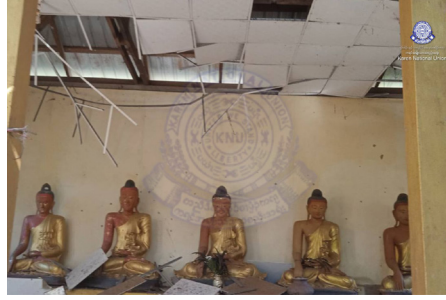
၂၀၂၄ နံၣ် လါနီၣ်တဘျီ ၃၀ သီအန့ၤ သုးမိစီရိအသုးတဖၣ် ခးလီၤကၠိၤဖးဒိၣ်လၢသဝီပူၤအဆၢ ဘၣ်ပးစီဝဲ သီခါပုၣ် ၀ ဖျၢၣ်ဒီး ဘၣ်ဒိဝဲ သီခါ ၀ ပါ ဖဲ ချၢၣ်လွၢ်ထွၢ်ကီၢ်ရၢၣ်, လၢနီၣ်ကီၢ်ဆၣ်ဟီၣ်ကဝီၤပူၤ