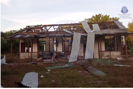
၂၀၂၄ နံၣ် လါနီၣ်တဘျီ ၀၀ သီအန့ၤ သုးမိစီရိအသုးတဖၣ် သ့ဝဲဒြီး တၢ်လီၤဝဲမုၢ်ဖိအဆၢ ဘၣ်ပးဟီၤဝဲ တၢ်မၤလီၤကၠိၤတဖျၢၣ်ဖဲ ချၢၣ်လွၢ်ထွၢ်ကီၢ်ရၢၣ်, လၢနီၣ်ကီၢ်ဆၣ်ဟီၣ်ကဝီၤပူၤ