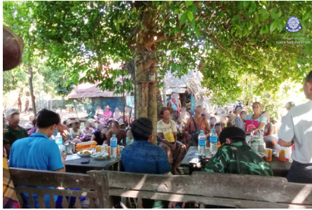
KORD ဟ့ၣ်လီၤဝဲ ကၠိၣ်စု တၢ်ဆိၣ်ထွဲမၤစၢၤဆူ ကမၤတၢ်ဖးဒိၣ်ကီၢ်ဆၣ်ဟီၣ်ကဝီၤပူၤအဆၢ ခိၣ်ဖဲ ချၢၣ်လွၢ်ထွၢ်ကီၢ်ရၢၣ် ဟီၣ်ကဝီၤပူၤ (၂၀၂၄ နံၣ် လါနီၣ်တဘျီ ၁၂ သီ)