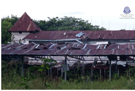
၂၀၂၄ နံၣ် လါအိၤကထိတဘျီ ၂၉ သီအန့ၤ သုးမိစီရိအသုးတဖၣ် သ့ဝဲဒြီး တၢ်လီၤမုၢ်ဖိအဆၢ ဘၣ်ပးဟီၤဝဲ ခရံၣ်ဖိတၢ်ဘၢသ့ၤသရိၣ်တဖျၢၣ် ဖဲ ချၢၣ်လွၢ်ထွၢ်ကီၢ်ရၢၣ်, လၢနီၣ်ကီၢ်ဆၣ်ဟီၣ်ကဝီၤပူၤ