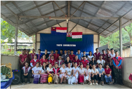
ကညီသးစၢ်ကရၢ တီခိၣ်ရိၣ်ဖဲဒီးရဲၣ်က့ၤမၤဝဲ ကညီသးစၢ် ဒီး ခုၣ်အံၣ်ယျၢၣ်ခိၣ်န့ၢ် အတၢ်ထံၣ်လိာ်တၢ်ဖိၣ်တံသကိးအမူး (၂၀၂၄ နံၣ် လါနီၣ်တဘျီ ၂၆ သီ)